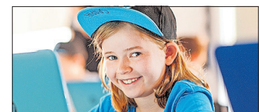
Programmieren macht Spass.

kann, darf sich schon auf den Herbst freuen. Zwischen dem 12. und 21. Oktober gehen zur Freude der jungen Freaks und ihrer Eltern im Familienzentrum Planaterra an der Reichsgasse und im Medienhaus Somedia an der Sommeraustasse 32 in Chur weitere Code-Camp-Programmierkurse über die Bühne. Infos auf www.codecampworld.ch .